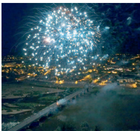
Feu d'artifice du 14 juillet de Moulins, tiré du pont RÉGEMORTES - © AgenceYUJO, MOULINS.

Et si... nous pouvions exceptionnellement, au cours d'un acte symbolique et en hommage pour ses soixante ans, pour ses bons et loyaux services rendus et n'ayant plus de locataires en son sein, tirer LE FEU D'ARTIFICE DU 14 JUILLET du haut de la Muraille de Chine ?