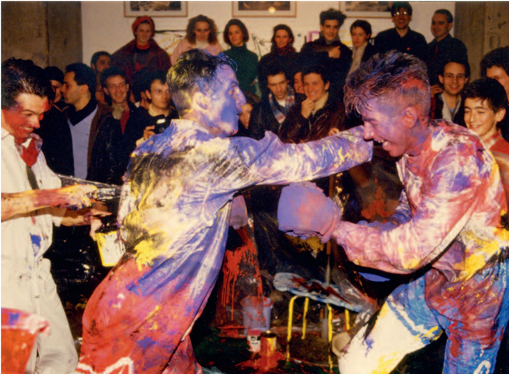
Boxe painting - © Sales gosses

Performance vendredi 14 février 1986, Galerie d'art contemporain (GAC) Quai des États-Unis, Nice « Carte blanche à Verbe d'État » : La comédie de l'art - Photo © Philippe Carbon pour Nice matin.