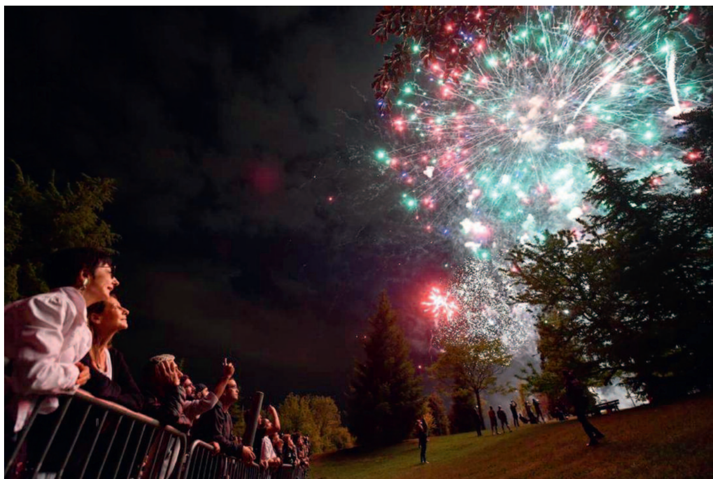
Feu d'artifice du 14 Juillet, Montjuzet, Clermont-Ferrand