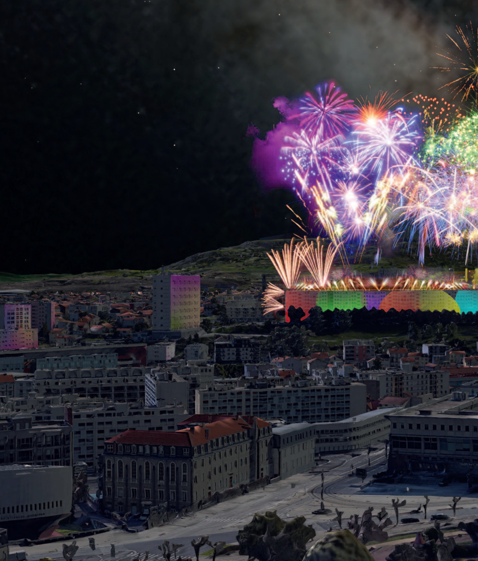
Feu d'artifice du 14 juillet 2022 tiré du haut de la Muraille de Chine à Saint-Jacques