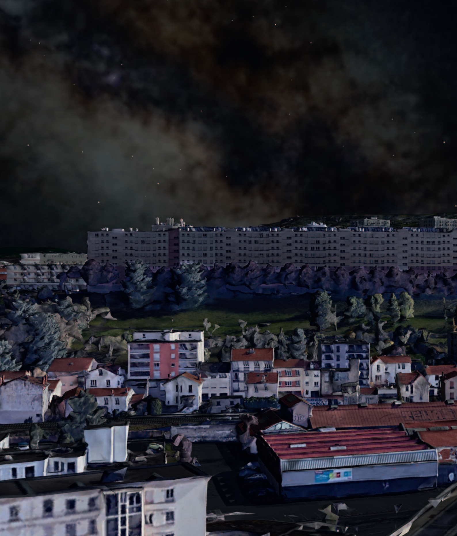
Face Nord de la Muraille de Chine la nuit et le viaduc Saint-Jacques- © Antonio Alvarez - 2021 Image créée avec le programme GoogleEarth®